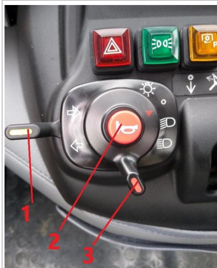
Funkcje włącznika oświetlenia