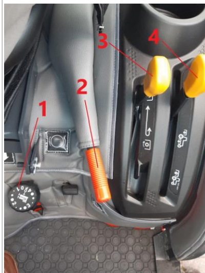
Widok przyrządów po lewej stronie operatora