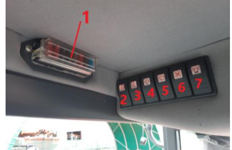
Opis włączników wyposażenia kabiny