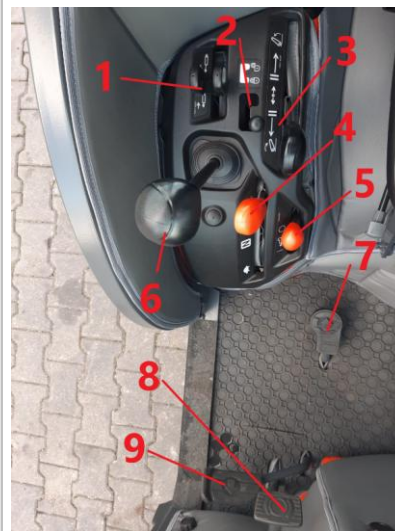
Widok przyrządów po prawej stronie operatora