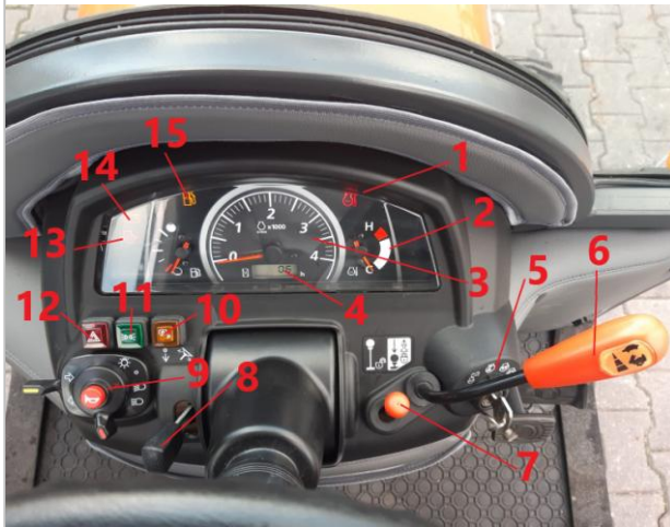
Widok ogólny tablicy rozdzielczej