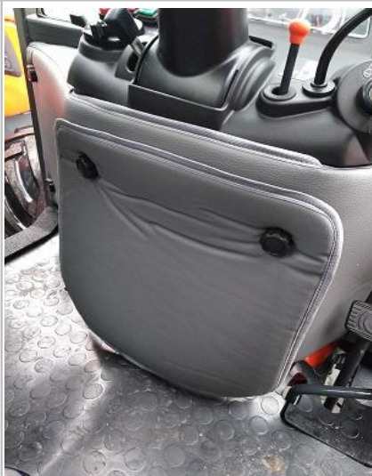
Umieszczenie akumulatora pojazdu